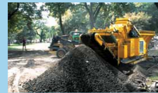
Использование RM60 при работах по благоустройству в природоохранных зонах и в городской черте