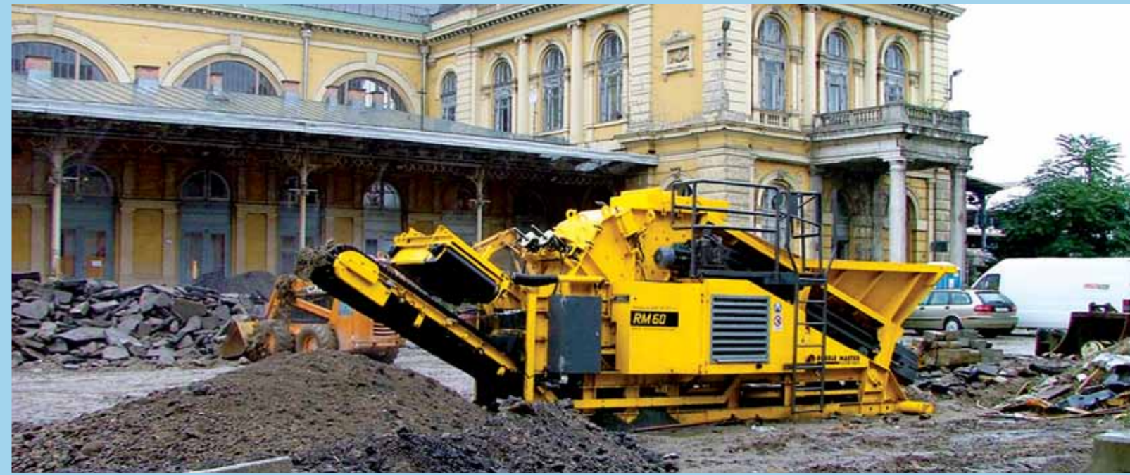
RM60 в работе на дроблении строительного лома в Австрии