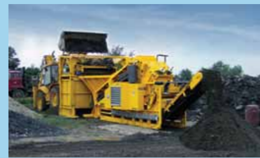
Минимальный износ камеры, благодаря совместному использованию установки RM60 с виброгрохотом предварительного отсеивания VS60