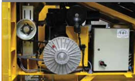
Незначительный расход топлива благодаря эффективной дизель-электрической концепции привода (ок. 12 л/ч)