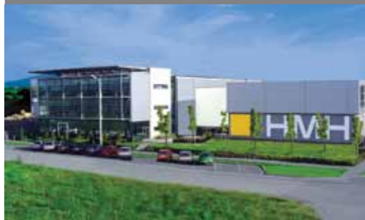
Современное здание центрального офиса и производственного комплекса компании RUBBLE MASTER в г. Линц, Австрия