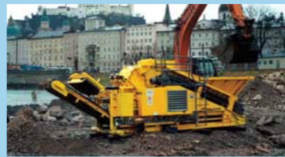
Высокие экологические показатели по уровням шума, пыли и выхлопных газов позволяют использовать оборудование в жилых кварталах

и прибылью. Использование дробильной установки RM60 совместно с грохотом предварительного отсеивания VS60, а также с грохотом для разделения продуктов дробления CS2500 является выгодным экономичным решением при переработке различных материалов. Оригинальные запасные части, расходные материалы и компоненты, а также износостойкие детали RUBBLE MASTER постоянно совершенствуются в совместной работе с поставщиками и предоставляются в распоряжение Покупателей в качестве отдельно подготовленных на заказ пакетов в зависимости от применения оборудования и поставленных задач.