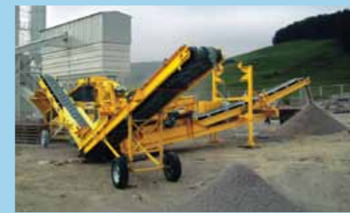
Совместное использование дробильной установки RM60 с виброгрохотом CS2500 позволяет достичь максимальной прибыли