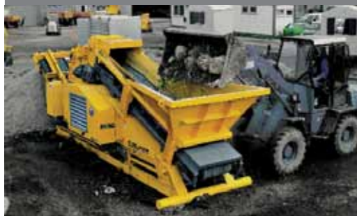
Переработка различного строительного лома, асфальта, кирпича и железобетона